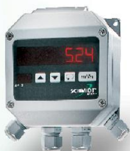
LED-Anzeige im Wandgehäuse